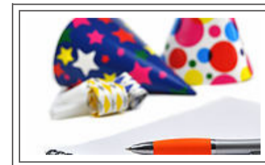
Unit 3 Plan A Party