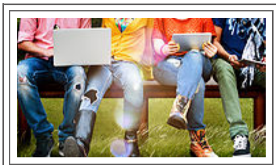
Unit 1 All About Me