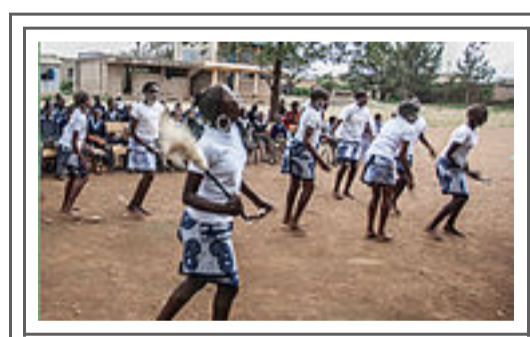
Unit 4 Into Africa