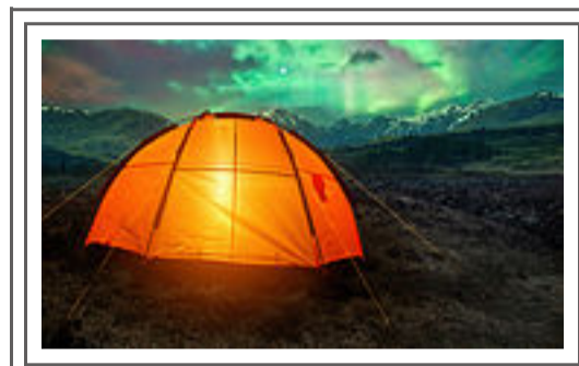
Unit 2 Vacation Get Away